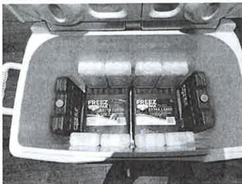
Muestra como se cubre las paredes del cooler con el gel pack

"Año de Lucha Contra la Corrupción e Impunidad" "Decenio de la Igualdad de Oportunidades para Mujeres y Hombres"