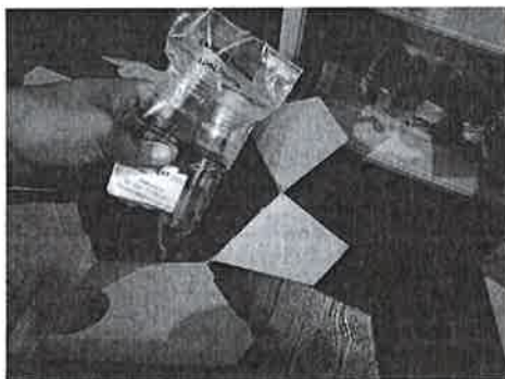
Muestra como se recibirán las muestras de sangre