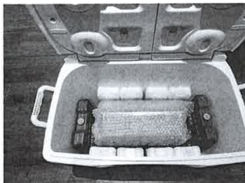
Cooler + gel pack + muestra de sangre + data logger (debajo de la muestra de sangre)